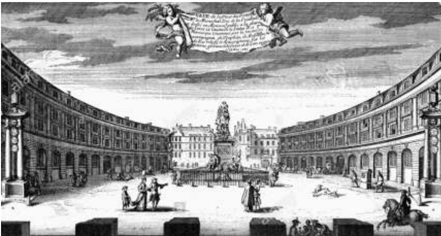
Paris, la Place des Victoires.