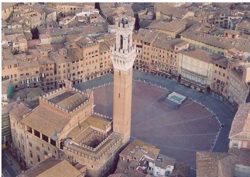
Le Campo de Sienne.