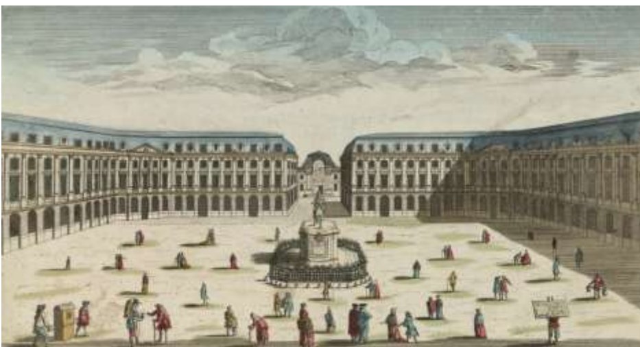
Paris, la Place Vendôme, au XVII e siècle.