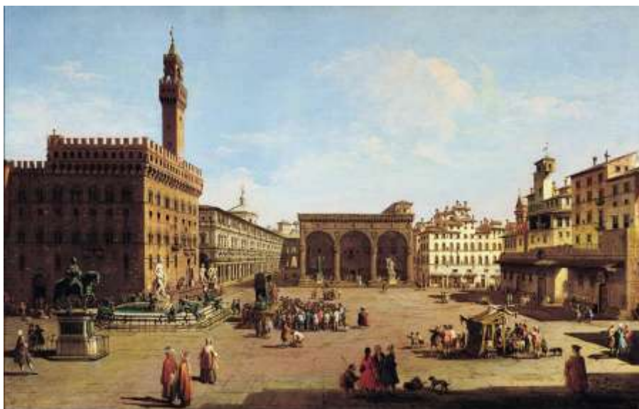
Florence, la Piazza della Signoria, peinture du XVIII e siècle par Zocchi.