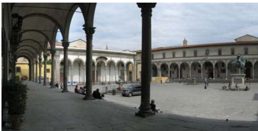
Florence, la Piazza della Santissima Annunziata.