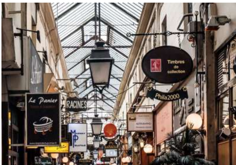
Passage des Panoramas, la verrière.