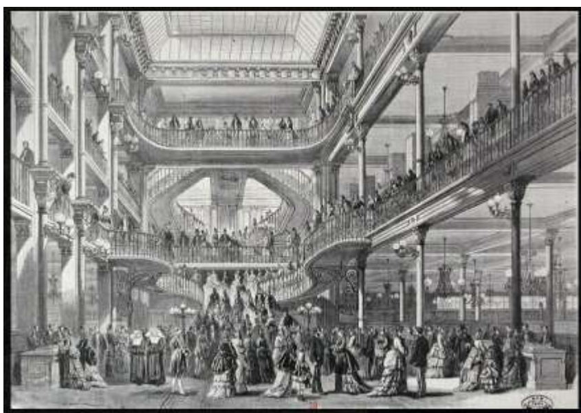
Le Bon Marché, L'Univers illustré , 1872.