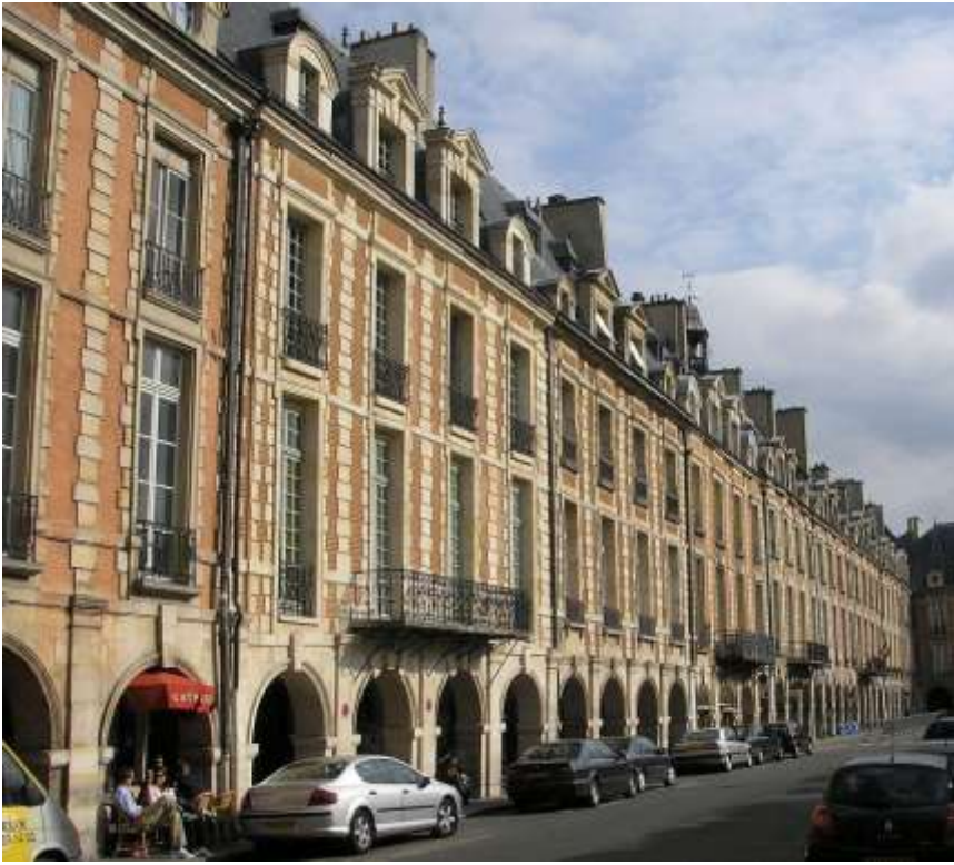
Paris, la Place des Vosges anciennement Place Royale.