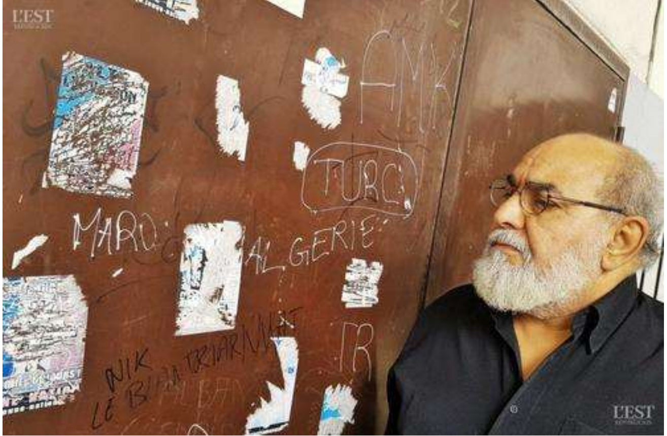
Autocollants racistes, croix gammée à l'entrée du café social, qui a également été victime d'une tentative d'intrusion.